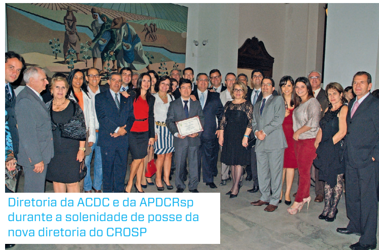
Diretoria da ACDC e da APDCRsp durante a solenidade de posse da nova diretoria do CROSP