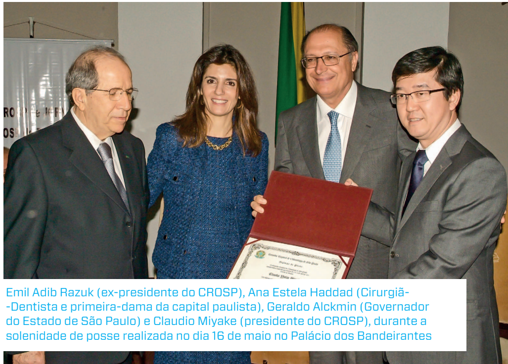
Emil Adib Razuk (ex-presidente do CROSP), Ana Estela Haddad (Cirurgiã-Dentista e primeira-dama da capital paulista), Geraldo Alckmin (Governador do Estado de São Paulo) e Claudio Miyake (presidente do CROSP), durante a solenidade de posse realizada no dia 16 de maio no Palácio dos Bandeirantes

► A ACDC é uma das maiores entidades do interior do estado de São Paulo, o que comprova sua força e sua importância no cenário da Odontologia ◀